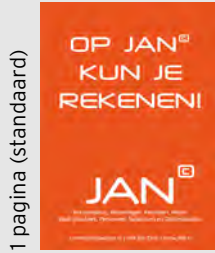
1 pagina (standaard)