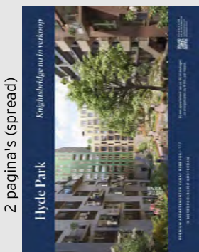
2 pagina's (spread)